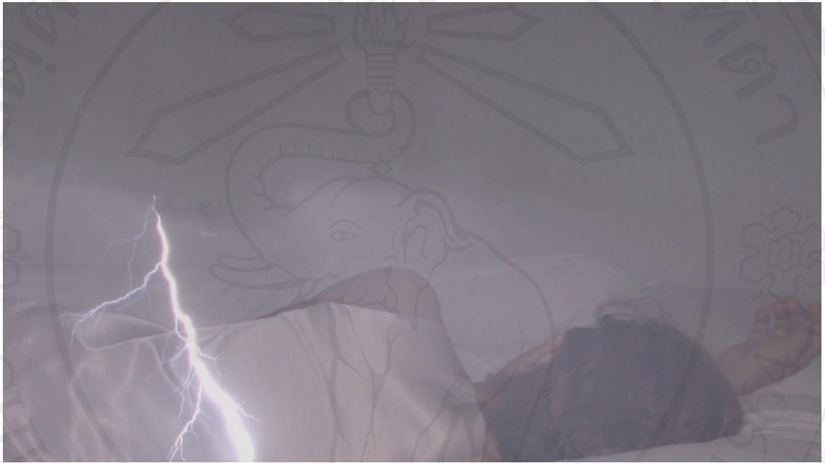
ภาพที่ 10 : ภาพนิ่งจากวิดีโอหน่วยที่ 2 : แม่ผู้กดคัน แม่กำลังนอนหลับและมีสายฟ้าฟาดผ่าลงที่ตัวท่าน