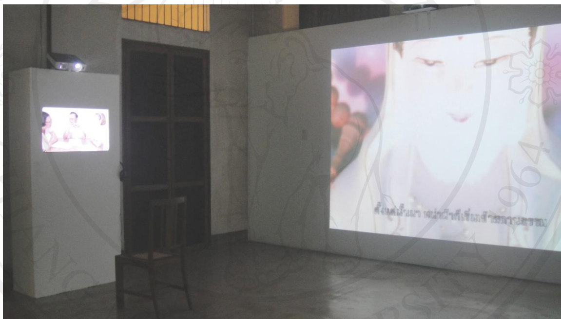
ภาพที่ 20 : ภาพถ่ายบรรยากาศภายในห้องแสดงงาน