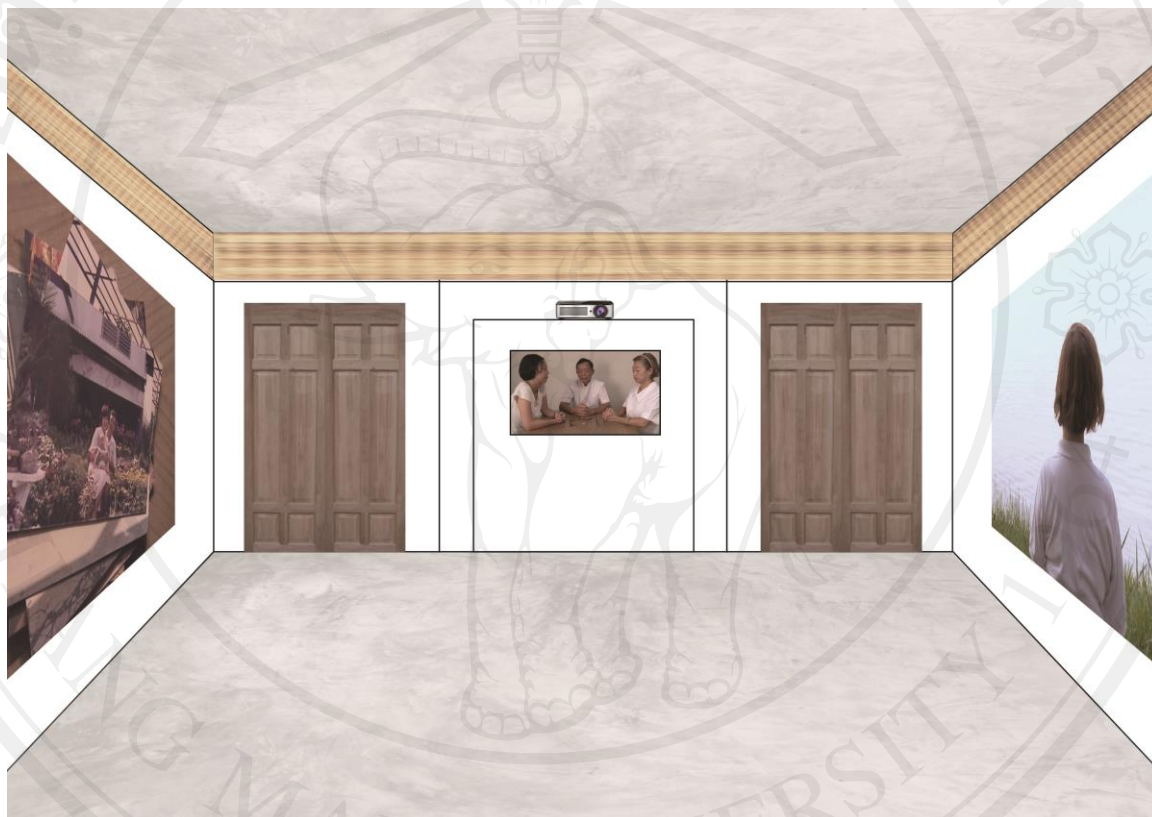
ภาพที่ 17 : ภาพจำลองการจัดวางผลงานภายในห้องแสดง

ภายในเป็นห้องโล่งกั้นจากผนังขาว ผนังด้านประตูทางเข้า ติดตั้งตู้ขนาด สูง 2 เมตร กว้าง 1 เมตร 50 เซนติเมตร สำหรับติดตั้งจอทีวีในระดับสายตาและด้านบนสำหรับวางเครื่องฉาย โดยทีวีโอ 3 หน่วยแรกจะถูกฉายลงผนังทั้ง 3 ด้านล้อมรอบจอทีวีที่อยู่ผนังกลางที่ฉายวิดีโอในหน่วยที่ 4