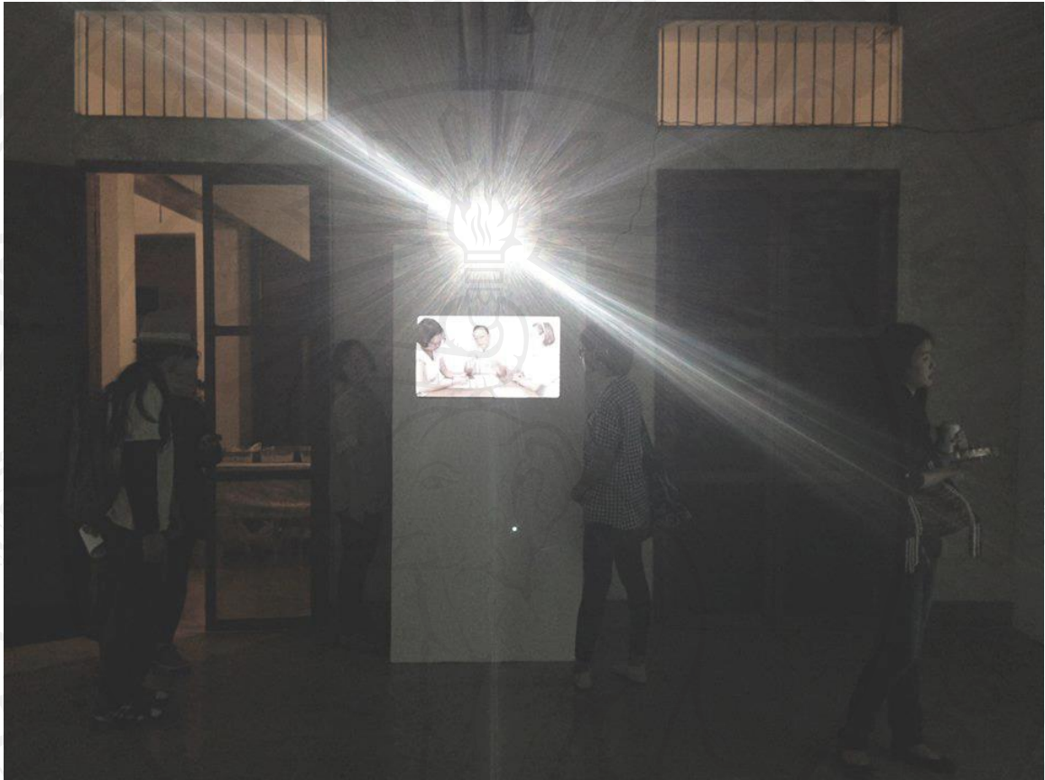
ภาพที่ 24 : ภาพถ่ายบรรยากาศการชมงานในวันเปิดนิทรรศการ