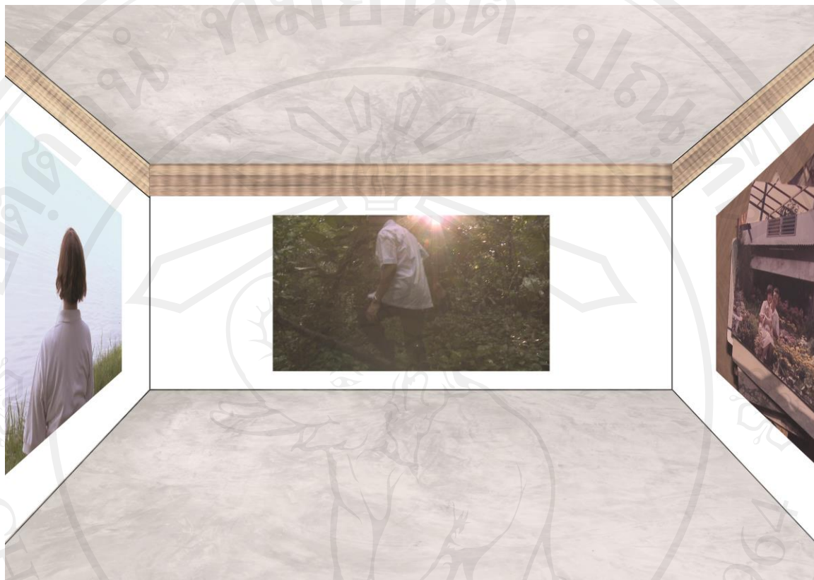
ภาพที่ 18 : ภาพจำลองการจัดวางผลงานภายในห้องแสดง