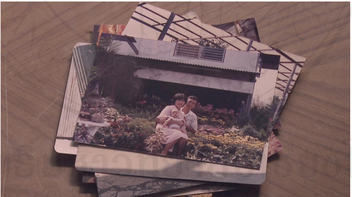
ภาพที่ 15 : ภาพนิ่งจากวีดีโอหน่วยที่ 3 : ลูกสาวผู้สำนักฝึกถ่ายภาพแก่สมัยข้าพเจ้ายังเป็นเด็ก