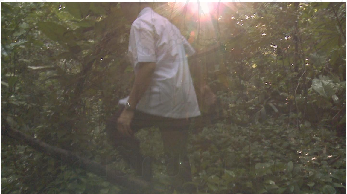
ภาพที่ 9 : ภาพนิ่งจากวิดีโอหน่วยที่ 1 : พ่อผู้อดทน พ่อกำลังเดินเข้าไปในป่า