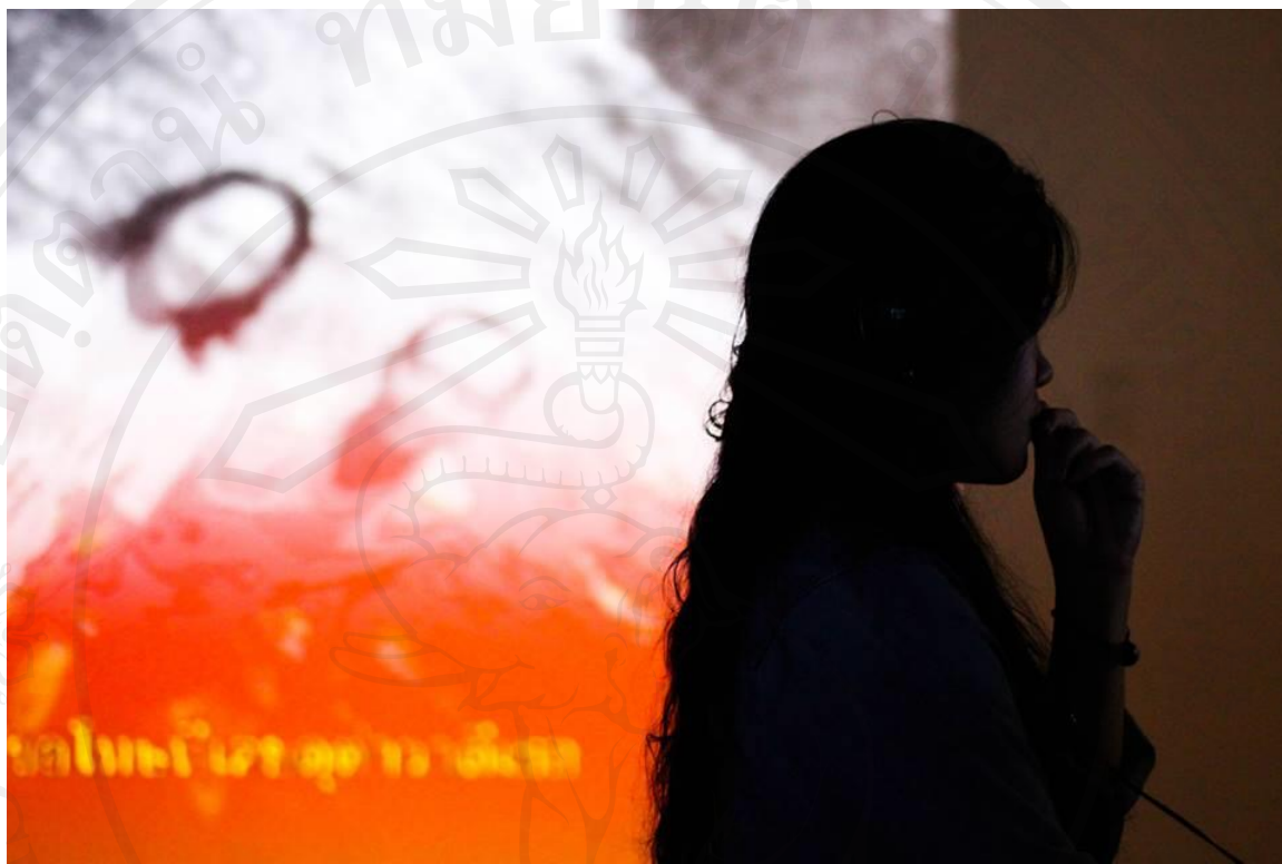
ภาพที่ 25 : ถ่ายบรรยากาศการชมงานในวันเปิดนิทรรศการ

ข้าพเจ้ามองว่าในส่วน of ผลงานงานวิดีโอจัดวาง (Video Installation) มีความจำเป็นอย่างยิ่งที่จะต้องมีส่วนในการฉายหรือแสดงซึ่งเป็นเสมือนพื้นที่ที่เรียกร้องความสนใจและการถูกจับจ้อง ในขณะเดียวกัน ภายในวิดีโอนั้นก็มีส่วนที่เป็นของตนเอง มีเรื่องราวเฉพาะที่ถูกเลือกสรร มีระยะเวลา ขนาดและมุมมอง รวมทั้งการจัดวางบรรยากาศการปิดล้อมต่อการรับรู้ ที่จะสามารถนำผู้ชมเข้าไปสู่ตัวงาน เข้าไปสู่สภาวะการณ์ที่เกิดขึ้นกับข้าพเจ้า