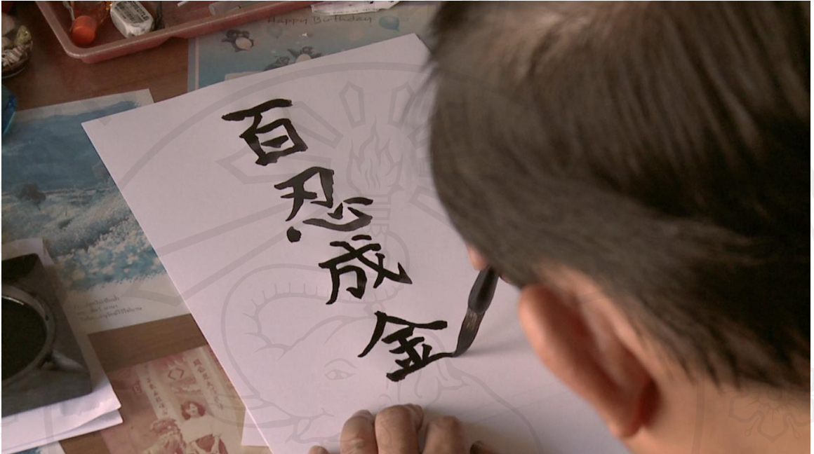
ภาพที่ 8 : ภาพนิ่งจากวิดีโอหน่วยที่ 1 : พ่อผู้อดทน พ่อกำลังเขียนสุภาษิตประจำใจด้วยพู่กันจีน