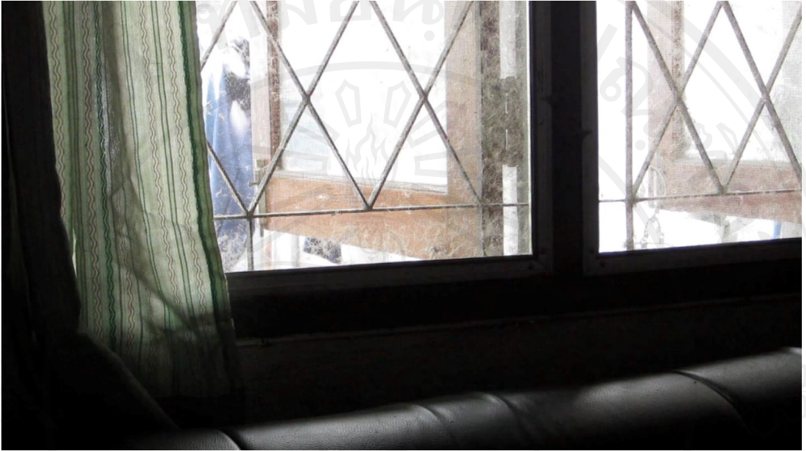
ภาพที่ 14 : ภาพนิ่งจากวีดีโอหน่วยที่ 3 : ลูกสาวผู้สำนักฝึกคิด ภาพหน้าต่างที่บ้าน