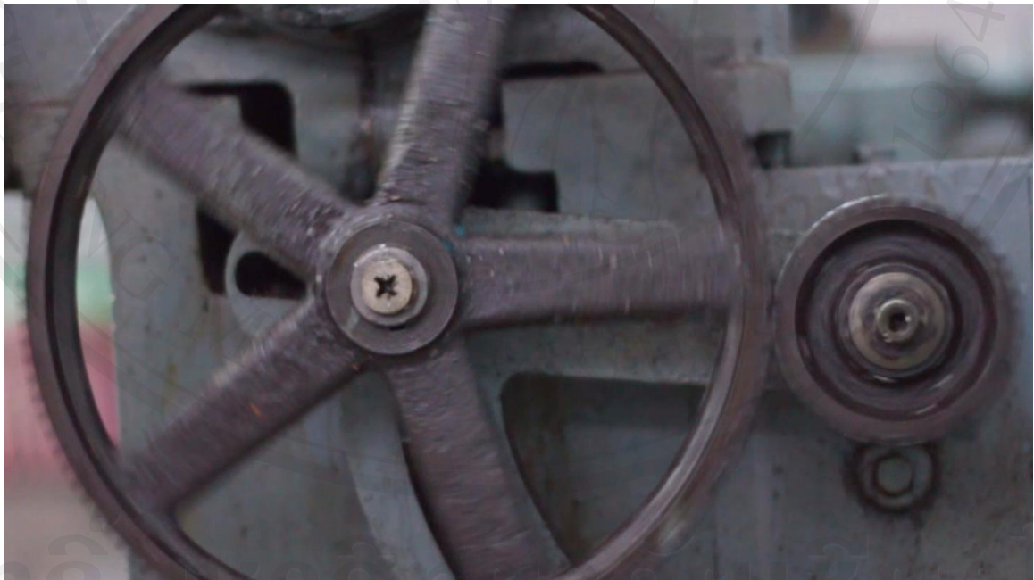
ภาพที่ 7 : ภาพนิ่งจากวีดีโอหน่วยที่ 1 : พ่อผู้อดทน ภาพเครื่องจักรกลทำงาน