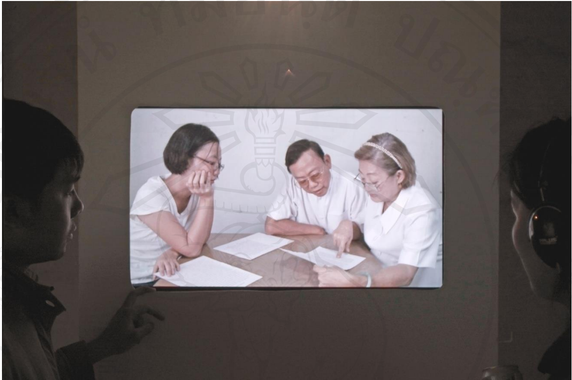
ภาพที่ 23 : ถ่ายบรรยากาศการชมงานในวันเปิดนิทรรศการ