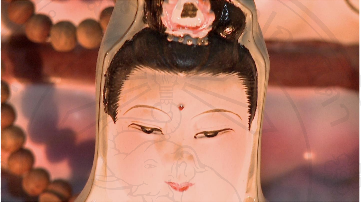
ภาพที่ 11 : ภาพนิ่งจากวีดีโอหน่วยที่ 2 : แม่ผู้กอดฉัน ภาพโต๊ะหมู่บูชาพระที่บ้าน