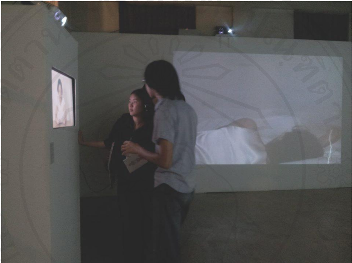
ภาพที่ 22 : ถ่ายบรรยากาศการชมงานในวันเปิดนิทรรศการ