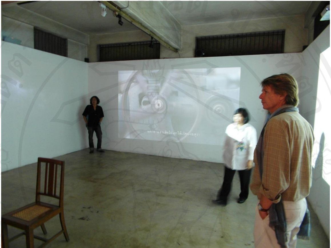
ภาพที่ 21 : ภาพถ่ายคณาจารย์กรรมการสอบเข้าชมงาน