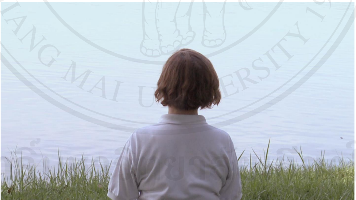
ภาพที่ 12 : ภาพนิ่งจากวีดีโอหน่วยที่ 2 : แม่ผู้กอดฉัน แม่กำลังนั่งสมาธิ