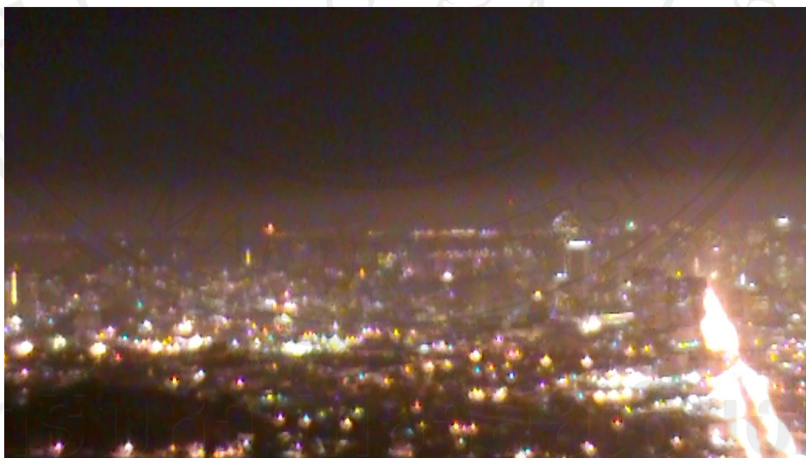
ภาพที่ 13 : ภาพนิ่งจากวิดีโอหน่วยที่ 3 : ลูกสาวผู้สำนึกผิด ภาพแสงสียามค่ำคืน

โดยผลงานวิดีโอหน่วยนี้จะเป็น วิดีโอสี ความยาว 20 นาที ขนาด HD16:9 ถ่ายด้วยเครื่องฉายลงผนังห้อง