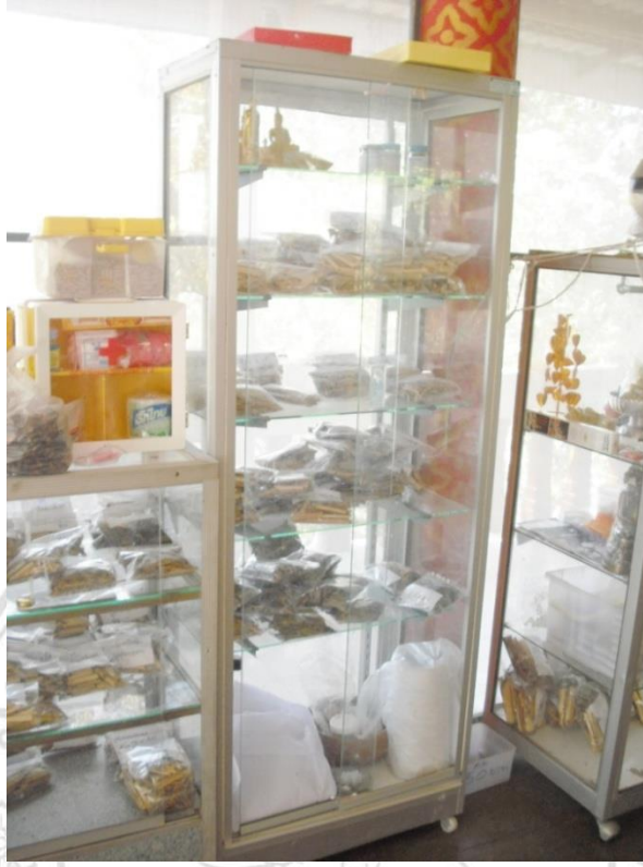
ภาพ 4.2 ตู้ยาสมุนไพรภายในศาลาวัดคอยกะหลก