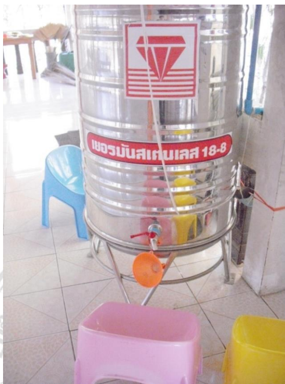
ภาพ 4.3 ถังน้ำมนต์