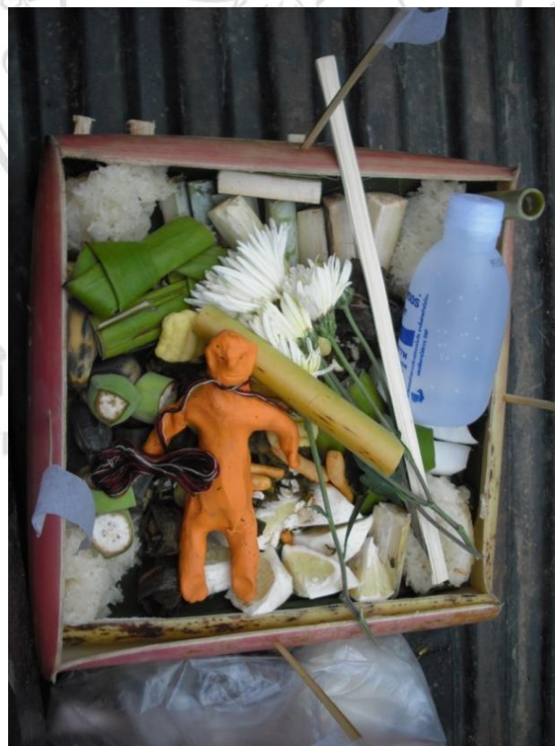
ภาพ 4.4 สะดวง

หลายอย่าง ได้แก่ ข้าวเหนียววางไว้ 4 มุมของสะดวง น้ำ กล้วยดิบหั่น อ้อยหั่น ส้มโอหั่น ดอกไม้ เมี่ยง ขนมขบเคี้ยว อาหารคาวที่เจ้าหน้าที่กำหนดให้จัดเตรียมมา และตุ๊กตาปั้นรูปคนขนาด 1 ฝ่ามือ ซึ่งในสมัยก่อนทำจากดินเหนียว แต่ปัจจุบันทำจากดินน้ำมันแทน โดยจะเลือกใช้สีไหนก็ได้ตามความ สะดวก คอของตุ๊กตาจะมัดกับเชือกไว้ ซึ่งเชือกนั้นจะนำไปมัดกับของที่ใช้แก้อีกที 2) ของที่ใช้ในการ แก้คุณไสย ซึ่งเป็นของอย่างเดียวกับที่หมอผีคนทำของได้ใช้ทำคุณไสยมายังผู้ป่วย ครูบาแสนจะบอก ให้ฝั่งผู้ป่วยเป็นคนเตรียมมาเอง ของที่นิยมมาทำคุณไสย เช่น ตะปู หนังกวาย ลีว แท่งเหล็ก เป็นต้น แต่ในปัจจุบันสิ่งของที่หมอผีใช้ทำคุณไสยมีความแปลกใหม่ไปจากเดิมหลายอย่าง เช่น เตาไมโครเวฟ สว่านไฟฟ้า หม้อหุงข้าว เครื่องซักผ้า ผ้าไหมราคาแพง เพชร ทองคำ เป็นต้น ซึ่งครูบาแสนอธิบายว่า สิ่งของเหล่านี้มีราคาแพงและหายาก ฉะนั้น ผู้ป่วยต้องเสียเงินจำนวนมากเพื่อซื้อหรือหาซื้อของ เหล่านี้มาทำพิธีกรรมแก้ หากของบางอย่างหายากหรือราคาสูงเกินไปจนผู้ป่วยไม่สามารถหาได้ ทำให้ครูบาแสนทำพิธีกรรมรักษาไม่ได้ ผู้ป่วยจึงไม่ได้รับการรักษา นี่จึงเป็นเหตุผลที่หมอผีเลือกใช้ ของแปลกๆ ที่หายากหรือราคาแพง เพื่อให้คนทำพิธีกรรมแก้คุณไสยไม่สามารถหาของชนิดเดียวกัน มาทำพิธีแก้ได้