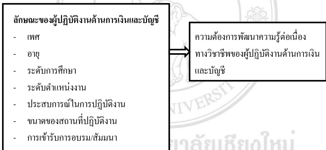
ภาพที่ 1 กรอบแนวคิดในการศึกษา

จากการศึกษาแนวคิด ทฤษฎีและงานวิจัยที่เกี่ยวข้องในการศึกษาความต้องการพัฒนาความรู้ ต่อเนื่องทางวิชาชีพของผู้ปฏิบัติงานด้านการเงินและบัญชีของโรงพยาบาลชุมชน ในจังหวัดลำปาง นำมา สรุปเป็นกรอบแนวคิดที่ใช้ในการศึกษาได้ ดังนี้