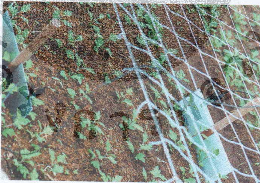
ภาพที่ 4 การเสียบแผ่นโลหะที่เชื่อมติดกับสายไฟเครื่องปรับแรงดันไฟฟ้าลึกระมาณ 15 เซนติเมตร