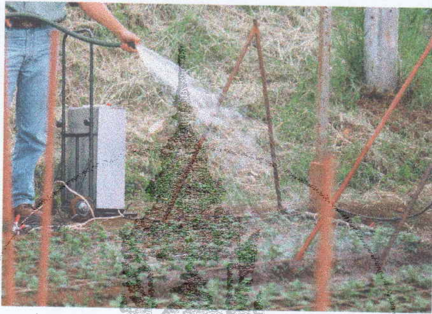
ภาพที่ 3 การรดน้ำแปลงปลูกก่อนปลดสายกระแสไฟฟ้า